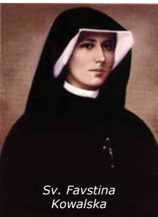
Sv. Faustina Kowalska

Danes je v Cerкви že zelo poznana in razširjena neka nova pobožnost – ki že ni več tako nova – namreč pobožnost k Božjemu usmiljenju. Pobudnik, če smemo tako reči, te pobožnosti je sam Jezus Kristus,