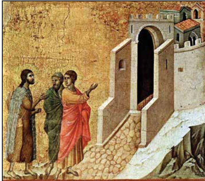
Jesus in učenca na poti v Emaus (Duccio di Buoninsegna, ok. 1300)