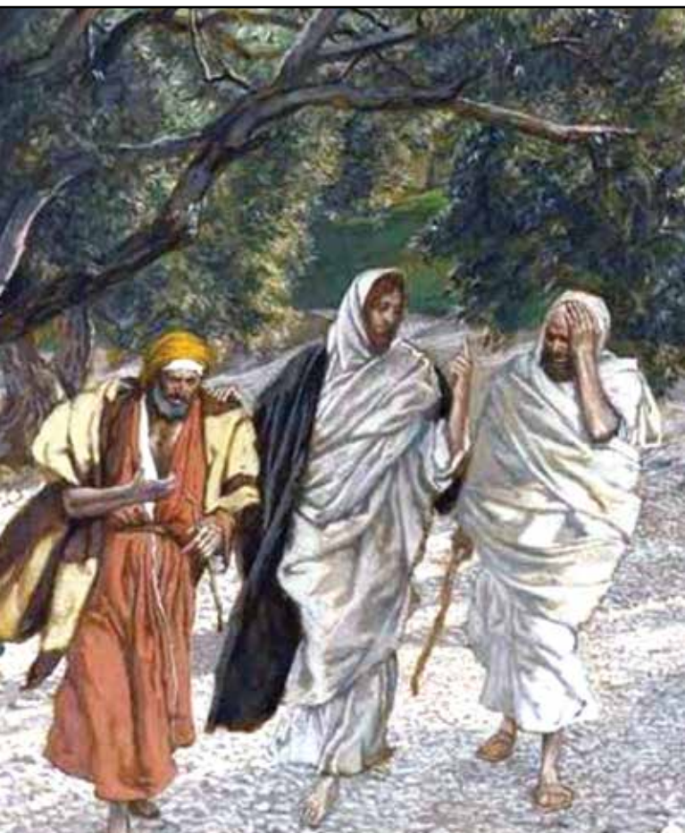
Na poti v Emavs

V bogoslužju se Cerkev pri gledanju obličja Vstalega pridružuje poti dveh učencev v Emavs. Čeprav je ta pot v Emavs naporna, vodi