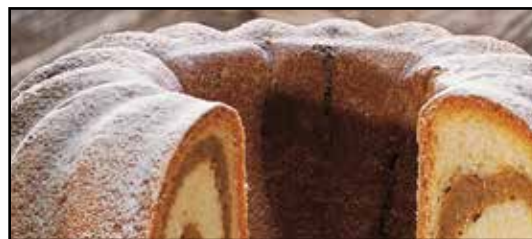
Šartelj ali šarkelj

Znanci in prijatelji s v Rožu za veliko noč pošiljajo šartelj, potico in dvoje rdečih jajc. Navadno nese dar domača hči, ki pa ne sme iti sama; prijateljica jo mora spremljati, ji "iti za psa". Tudi na Primorskem je navada, da dobijo otroci od sorodnikov velikonočni dar. Pri Sv. Ivanu v Trstu so jim dajali rdeče pirhe, titole, velike kose presneca in maslenega ("zabeljenega") kruha. V Beneški Sloveniji sta novoporočenca deležna darila od "njene" hiše, če se je nevesta primožila, ali pa od njegovih staršev, če se je "on" priženil. Spečejo jima lepo "gubanico", kupijo pleten koš, jo položijo vanj, dodajo skledico in žlico in jima vse skupaj odnesejo v dar. Lepa je navada v Nadiški dolini, da družina, ki je imela nedavno mrliča v hiši, pošlje pogačo ali "žegnanico" kakemu siromaku v vasi. Včasih je dobil "žegnanico" tudi tisti, ki je pri pogrebu nosil križ. Če je umrl moški, mu je "žegnanico" nesel moški, če je umrla ženska, pa ženska.