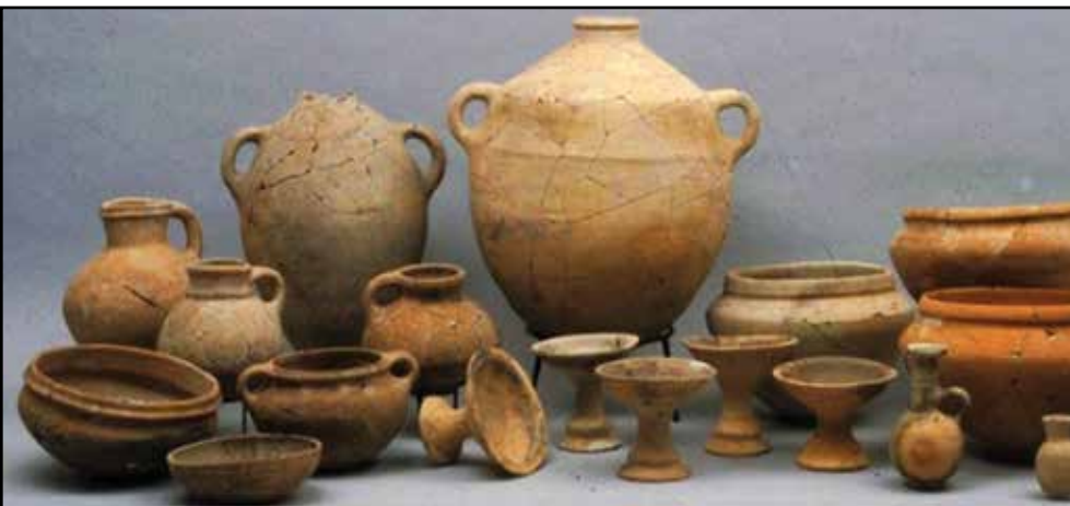
Nekaj ohranjene palestinske keramike

Edino idejo, ki bi mogla imeti kaj umetniškega, je Judom dala keramika. Tej pa res ni manjkalo očarljivosti. Vrčke iz rdeče gline, okrašeni s črnimi krogi, skodele iz rumene gline, na katerih lepa rdeča barva poudarja fine okrogline so izkopali na več krajih. Pa so to judovski izdelki, ali pa so bili uvoženi iz Aleksandrije ali Cipra? Bogataši tistega časa so kupovali lepo posodje zunaj Palestine, revnim je bilo pa malo mar za te posvetne okraske.