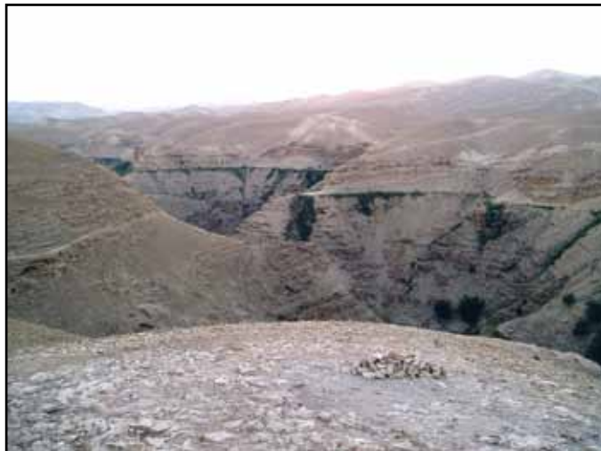
Pot iz Jeruzalema v Jeriho

Ti so bili kuga tistega časa. Celo v Italiji je imela cesarska policija dosti opraviti z borbo proti tej šibi božji. Pri branju evangelija ostanemo presenečeni, ko ugotovimo, kako pogosta je bila v vsakdanjem življenju nevarnost tatvin, plenitve in napadov