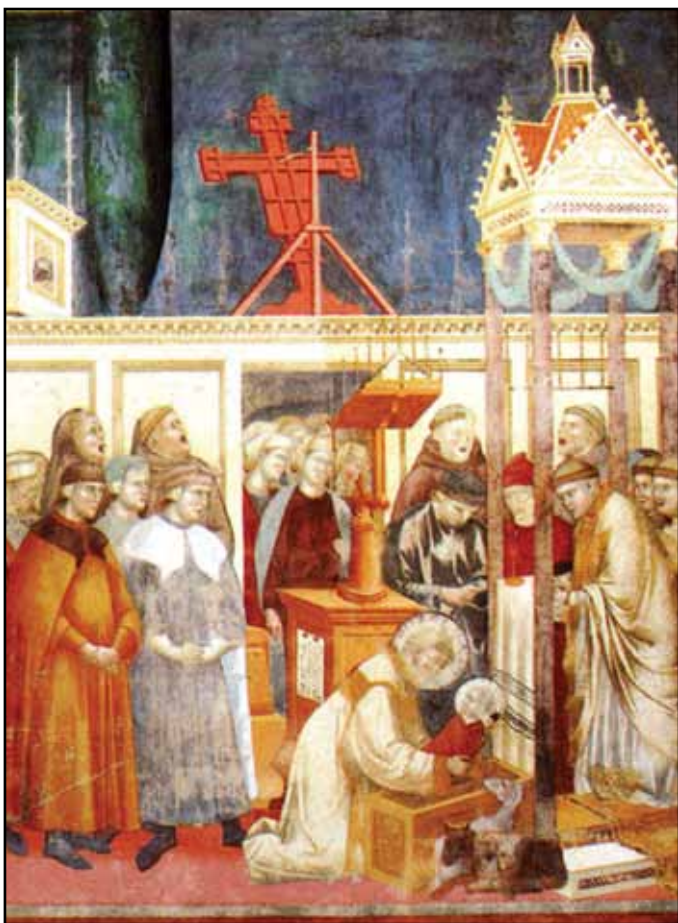
Giotto di Bondone: Frančiškove jaslice v Grecciu

Ne vemo natančno, kdaj so začeli postavljati jaslice po cerkvah in hišah, eno je gotovo, da izvirajo iz božične skrivnosti in da so se nam zdaj tako priljubile, da brez njih ni božiča. Postavljamo jih po cerkvah, hišah in ponekod celo na javnih krajih. Včasih so na vso moč podobne dejanskim okoliščinam Jezusovega rojstva, včasih pa imajo tako izrazit krajevni značaj, da le-tem komaj še ustrezajo. Na glavni železniški postaji v Rimu, Roma Termini , železničarji postavijo jaslice iz železniških pragov, tirov, kretnic, čuvajnic, pa tudi pastirji so vsi oblečeni v železničarske obleke. Po Afriki so vsi pastirji temnopolti, celo Jezušček v hlevu je črnc. Pri nas pa ponekod oblečejo pastirje v narodne noše, tako da jaslice ne predstavljajo več samo Jezusovega prihoda med nas, temveč tudi naš prihod k njemu. Jaslice so torej najbolj živa predstavitev božične skrivnosti in najbolj naš izraz umevanja te skrivnosti.