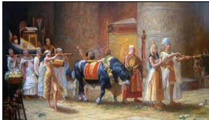
Sprevod svetega bika Apisa

treba braniti. Vrhnji plašč je bil obvezen, če je bilo poletje že mimo ali pa je bilo treba prelesti hribe – tisti debeli plašč, ki ga je sveti Pavel tako cenil (prim. 2 Tim 4,13). Če je popotnik jahal, je nosil s seboj meh z vinom ali s kisom pomešane vode, sicer je pa bil zadovoljen s čutaro. Nikoli pa niso šli na pot brez posušene buče, v katero so dali kamen za obtežbo, da bi mogli zajeti vodo iz obpotnih vodnjakov ne da bi bilo treba prositi za to uslugo kakega brezbožneža, na primer Samarijana.