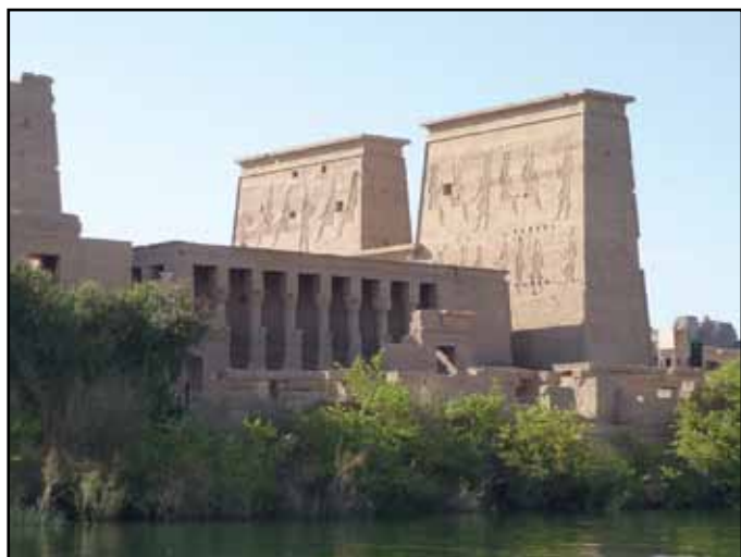
Izidin tempelj na Nilovem otoku File

Bilo je pa še mnogo drugih razlogov za potovanja. Kaj nimamo pri branju evangelija vtisa, da je bilo judovsko ljudstvo neprestano na poti čez hribe in doline? Pogosto so bile vzrok potovanj družinske vezi: tako je mala Devica Marija obiskala svojo sorodnico Elizabeto – Marijino obiskanje. Romanja so spravila na cesto na tisoče, na desettisoče popotnikov. Predvsem v času velikega velikonočnega praznika se je nepretrgana reka romarjev vzpenjala proti Jeruzalemu in se po končanih obredih vračala, kot je to razbrati iz Lukovega evangelijskega odlomka o malem dečku Jezusu, za katerega sta bila Jožef in Marija prepričana, da je v neki drugi skupini romarjev. Končno in predvsem pa so potovali zaradi posla. Na glavnih cestah ni bilo videti samo judovskih trgovcev, ampak tudi sloke nabatejske popotnike, vplivne babilonske poslovneže, oblečene v svilo in s težkimi obroči v nosu, debele sirske mešetarje,