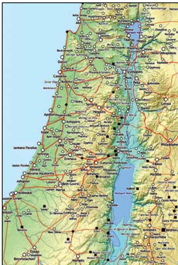
Sistem palestinskih cest v Jezusovem času

novana "kraljevska cesta", ki se je od pristanišča Cezareje preko Scythopolisa (stari judovski Bet Š'an), kjer je presekala pot jug-sever po gričih in se pri Deratu na navezala glavno cesto proti Damasku. Bolj na jugu je bila pot iz Jafe preko Nablusa in Sihema, ki je šla med gorama Ebal in Garizim. Končno so bile ceste, ki so šle zvezdasto v vse smeri iz Jeruzalema: dve v Gazo, ena preko Betlehema in druga preko Ued