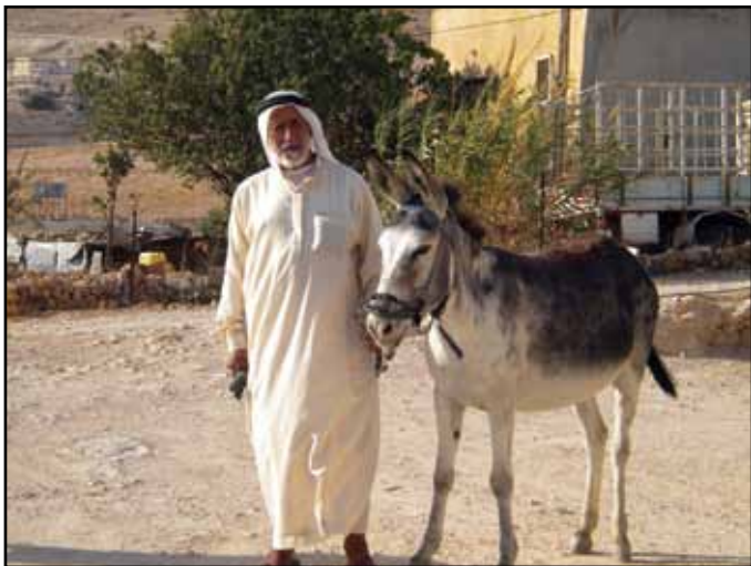
Osel – jezdna in tovarna žival

podjetja, s katerimi so podpisovali pogodbe za najemanje oslov in oslarjev. Spis Baba Mecia natančno navaja določbe celo za kakovost živalske krme in največje teže, ki jo je dovoljeno naložiti oslu na hrbet. Za dolga pota so izbirali osle iz Likaonije, ki jih je bilo težko voditi, so bili pa najmočnejši od vseh. Konj, ki so se ga redno posluževali za potovanje Rimljani – bil je najboljši za službo cesarske pošte – je bil pri Judih sicer malo v rabi, so jih pa imeli, saj spis Šabat čuti potrebo, da natančno določi pogoje, pod katerimi je bilo mogoče poskrbeti zanj na dan svetega počitka in