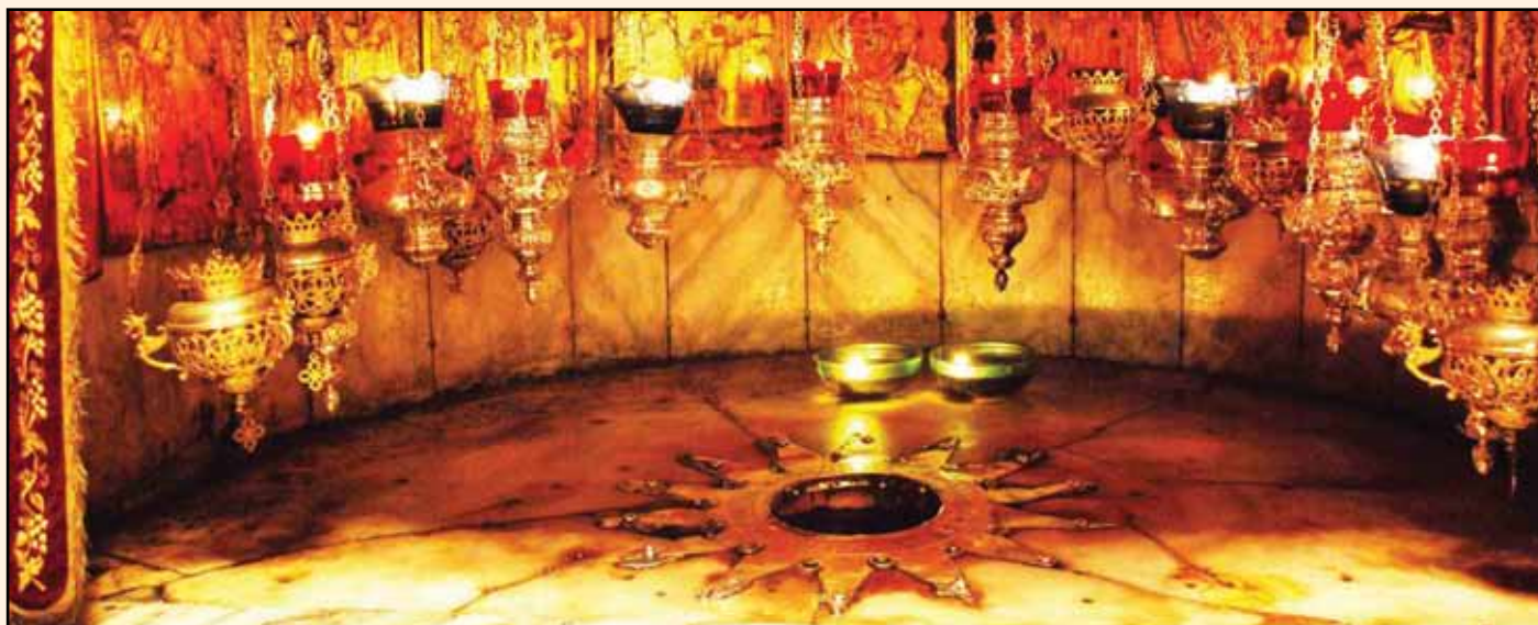
Kraj Jezusovega rojstva v betlehemski baziliki

Sicer nisem molil in prosil Boga za razsvetljenje, tudi nisem vzel v poštev razmer in svojih zmožnosti, marveč sem brez temeljitega premišljevanja stopil čez prag, ki je nad njim zapisano "Virtuti et Musis". Navzlic temu bi sodil, da sem bil poklican.