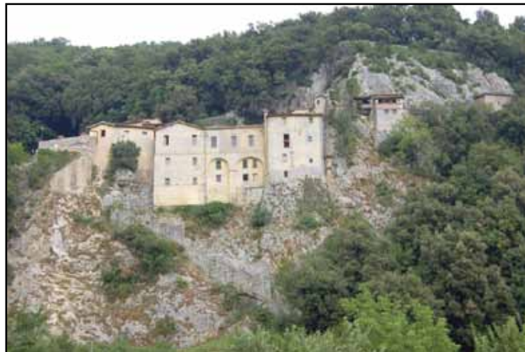
Greccio – kraj Frančiškovih živih jaslic leta 1223

»Vol pozna svojega gospodarja in osel jasli svojega gospoda« (1,3). Ker je tudi prerok Habakuk prerokoval, da se bo Mesija razodel med dvema živalima (3,2), so začeli v 8. stoletju postavljati k Jezusovim jaslim tudi vola in osla.