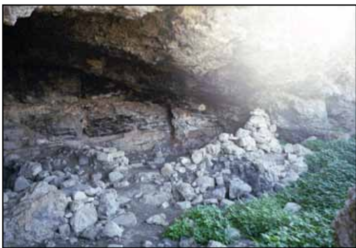
Ostanki kamnitih jasli v palestinskem hlevu

Ko je Marija rodila Jezusa, ga je – kakor vsaka hebrejska mati – najprej umila. Nato ga je posula s soljo v prepričanju, da ga bo sol okrepila (Ezk 16,4; Job 38,8-9). Roke in noge je trdno povila, da bi ravno rasle. Končno je vsega povila v plenice in ga položila v jasli, ker ni imela zibelke, kakor jo je imel, od Abrahamovih časov naprej vsaka, tudi najbolj revna palestinska mati. Jezusova zibelka so bile torej jasli. Evangelist Luka v kratkem poročilu Jezusovega rojstva (2,1-21) kar trikrat pravi, da ga »je povila v plenice in položila v jasli« (2,7.12.16). Ker so jasli del hleva, lahko z gotovostjo rečemo, da je bil Jezus rojen v hlevu.