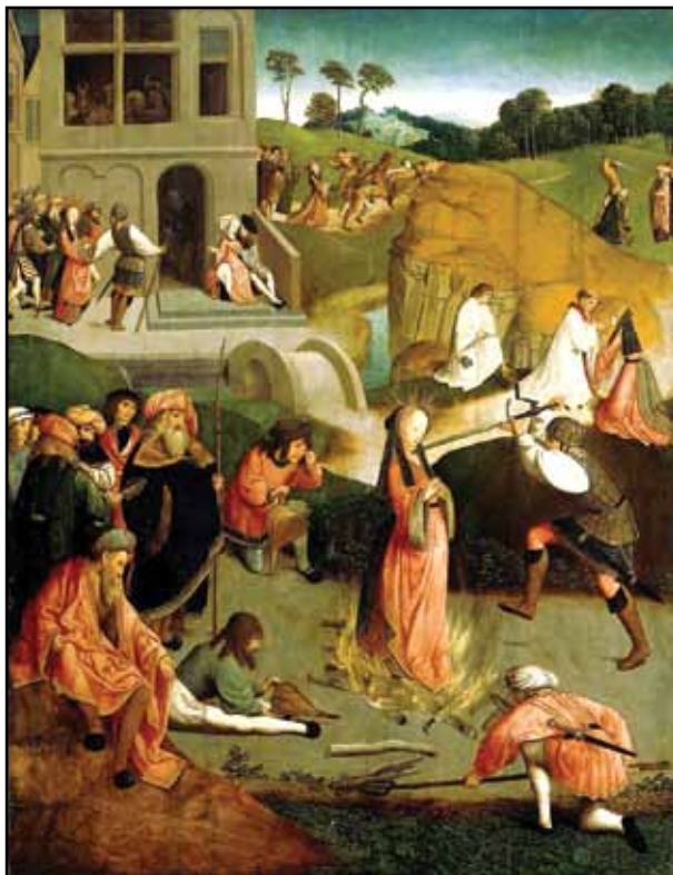
Mučeništvo sv. Lucije (neznan slikar)

Opis iz Slovenskih gor izpred druge svetovne vojske dolgujemo Ignacu Koprivcu: »God svete Lucije prinese v morečo jesensko enoličnost vsaj nekoliko spremembe. Otroci se na predvečer godu svetnice