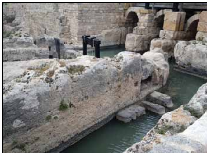
V Crocodilopolisu so branili mumije krokodilov

Za potovanje in za trgovsko tovorjenje je bila običajna žival osel: na gorskih skalnatih in pogosto ozkih poteh mu ni bilo enakega. Bila so tudi prava