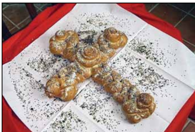
Lucijin kruh – lucijščak

Prekmurski "polažič" nabere na dvorišču drva, pride z njimi v izbo, poklekne in vošči: »Bog vam daj telko pujsekov, kak je na mojej glavi vlasekov...« Naštevava vse vrste živine in perutnine in želi obilen zarod. Medtem ko izreka voščilo, razmetava polena po vsej hiši. Gorički otroci hodijo na Lucijin dan "po Lucinji" ali po "kodakanju". Koledujejo za obilno nesnost kokoši. Navsezgodaj, že ob štirih zjutraj, pridejo v hišo in vržejo v sobi nekaj polen pod mizo ali v kuhinji pod ognjišče. Drva nakradejo pri sosedu, jih pusté po kodakanju v sobi in vzamejo zato na dvorišču gospodarjeva, ki jih odneso v sosednjo hišo, kjer naredo isto. Voščilo se glasi: »Kokodák, kokodák,