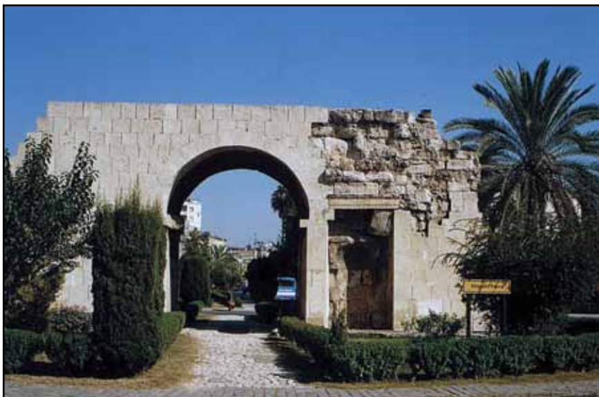
Mestna vrata iz Pavlovih časov

V Pavlovem apostolatu ni manjkalo težav, ki pa se jih je lotil s pogumom zaradi ljubezni do Kristusa. On sam se spominja, da je deloval »v hudih naporih... v ječah... pod udarci, večkrat v smrtni nevarnosti... trikrat so me bičali, enkrat kamnali, trikrat sem doživel brodolom... v nevarnostih na rekah, v nevarnostih pred razbojniki, v nevarnostih pred rojaki, v nevarnostih pred pogani, v nevarnostih v mestu, v nevarnostih v puščavi, v nevarnostih na morju, v nevarnostih med lažnivimi brati; v trudu in mukah, v pogostem bedenju, v lakoti in žeji, v pogostih postih, v mrazu in goloti; poleg tega še vse, kar me dan za dnem zaposluje, skrb za vse Cerkve« (2 Kor 23-28). Iz odlomka v Pismu Rimljanom (prim. 15,24.28) je viden njegov načrt priti prav do Španije, na skrajni konec Zapada, da bi oznanjal evangelij vsepovsod, do kraja takrat znane zemlje. Kako ne bi občudovali takega človeka? Kako se zahvaliti Gospodu, da nam je dal apostola te veličine? Jasno je, da se ne bi mogel spopasti s tako težkimi, včasih obupnimi pogoji, če ne bi bilo razloga brezpogoje vrednosti, spričo katerega ni bila nobena meja dokončna. Vemo, da je bil za Pavla ta razlog Jezus Kristus, o katerem piše: