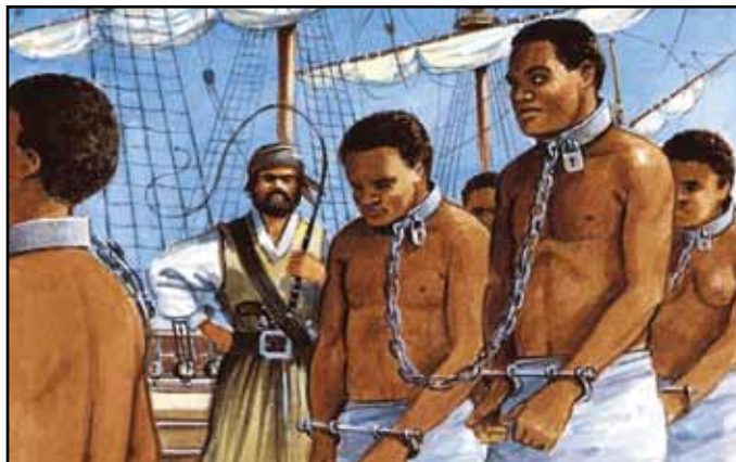
Na poti v suženjstvo

Ti prvi misijonski gojenci s svojimi ognjevitimi