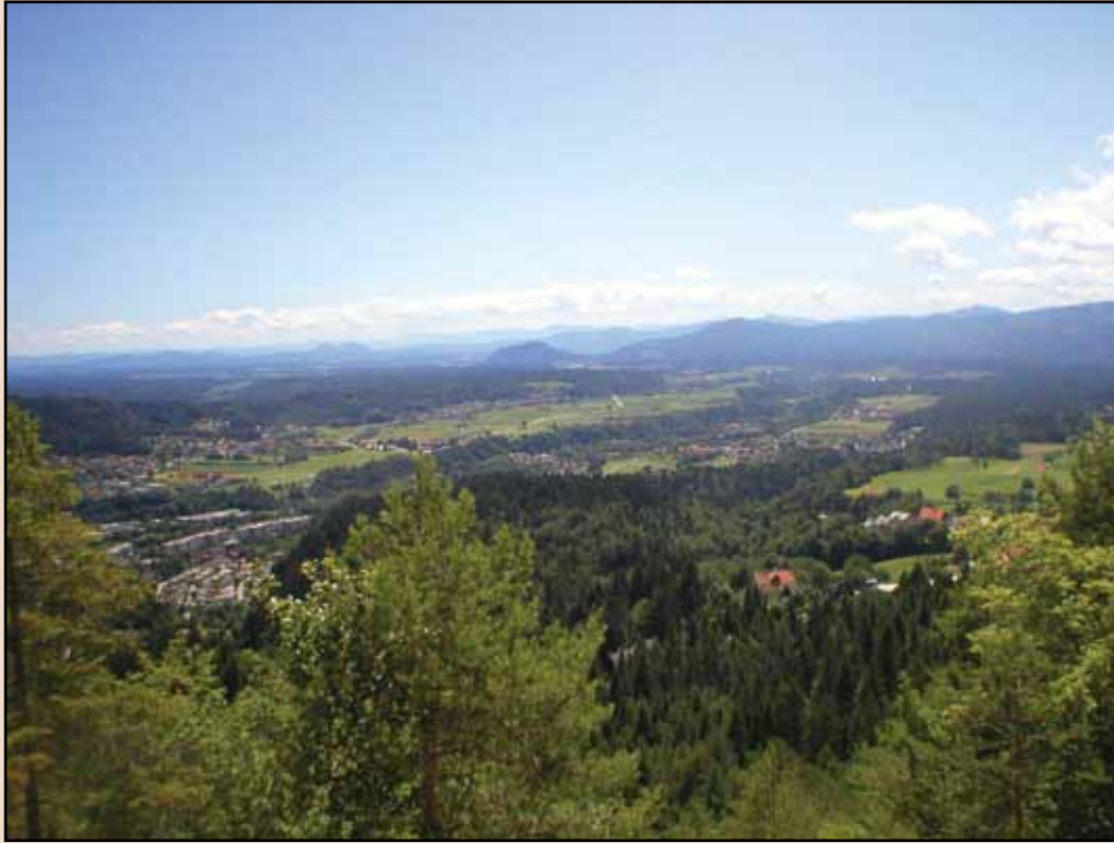
Pogled s ceste Begunje – Tržič na Kovor neposredno pod hribom ter na Gorenjsko v smeri proti Kranju in Ljubljani. V ozadju slike sta na sredini vidna Šentjošt in Šmarjetna gora nad Kranjem, levo pa še bolj oddaljen dvojni vrh Šmarne gore in Grmade nad Ljubljano. Čisto na obzorju pa je viden Krim in začetek Dolenjskega hribovja.