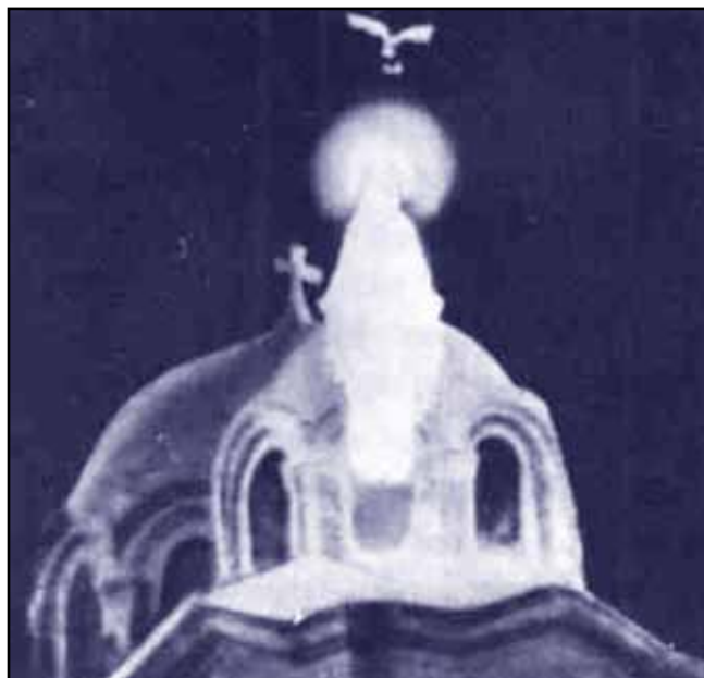
Žal boljše slike ni bilo mogoče dobiti

Nekateri vidijo v "prikazovanju" neke vrste od-