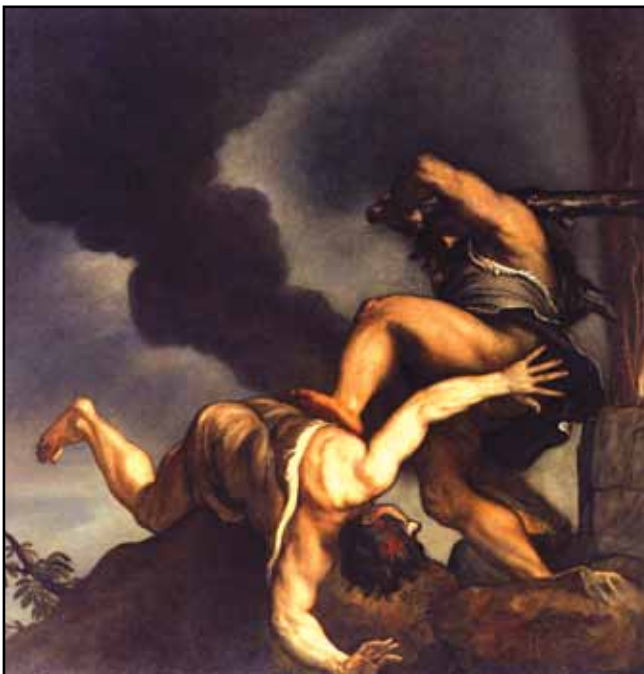
Kajn ubije Abela

Plaz, ki je začel drseti navzdol, se zlepa ne ustavi. Pisatelj Prve Mojzesove knjige gleda človeštvo in njegovo zgodovino in razmišlja o vzrokih propada, ki ga vidi. Samo eno razlago najde za ta propad: človek je pretrgal svoje stike z Bogom. Poročilo o