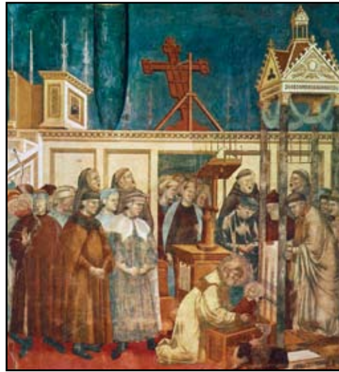
Božič v Grecciu Giotto di Bondone, ok. 1300

Nad jasljami poteka slovesen obred maše in duhovnik okuša nenavadno tolažbo. Svetnik božji se obleče v levita, kajti bil je diakon, in poje z zvonkim glasom evangelij; tisti njegov krepki, prijetni, čisti in pojoči glas vabi vse k največji nagradi. Nato pridiga ljudstvu in pripoveduje ganljive reči o rojstvu revnega Kralja in o malem mestu Betlehemu.