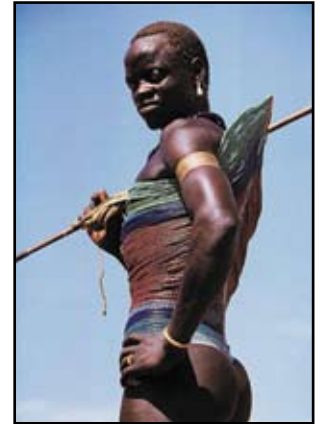
Dinka v oklepu

Knoblehar in njegovi misijonarji so delovali zlasti med Barijci v Gondókoru in v okolici. Imeli so pa prav malo uspehov. Ta črni rod stanuje od vseh Nilotov najbolj na jugu: na ravnini, ki se preko nje začne počasi pomikati Beli Nil, ko je prišumel iz gorate dežele Ugande, in pa na nizkih gričih in grebenih, ki se vzdigujejo z levega dela te ravnine proti Belgijskemu Kongu (Kongo Brazzaville danes). Na severu so pomešani z rodом Beri, ki je precej manjše postave. Barijska dežela je zelo lepa. Travnate planjave se menjavajo z gozdnatimi griči, čedne hišice gledajo izpod visokih dreves. Tukaj rastejo zlasti kuruléngi. Njihovi sadeži so podobni našim orehom; z oljem, ki ga iztiskajo iz njih, si mažejo kožo, da jim v ostrem vetru ne razpoka in jih ne skeli. Okrog vsake kočice je speljan pokrit hodnik. Kočo in gospodarska poslopja obdaja živa meja iz visoke, rumeno cvetoče evforije, ki je podobna kaktusu.